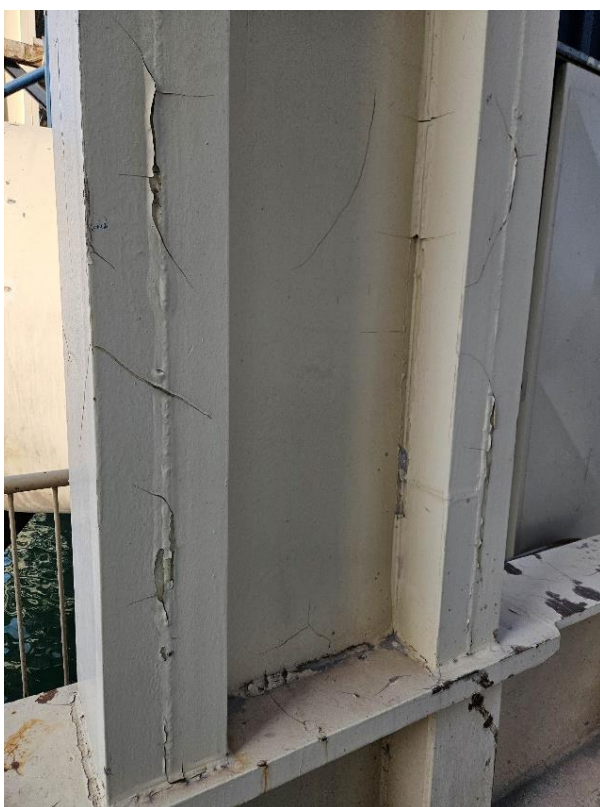
Slika 6 - 7. Prikaz stanja glavne nosilne konstrukcije galerije