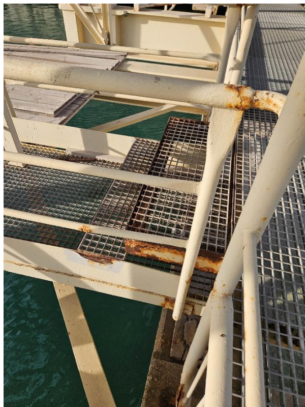
Slika 4. - 5. Prikaz stanja konstrukcije in ograj glinice