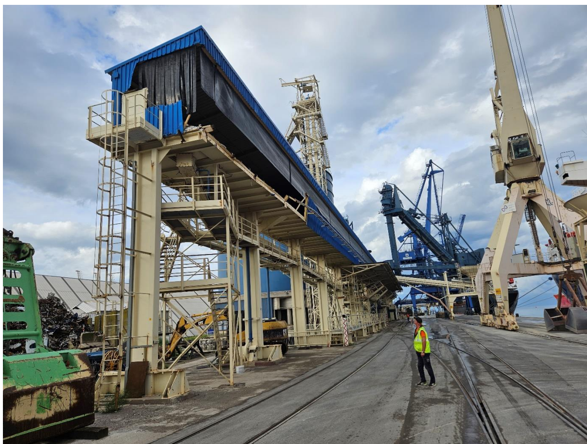
Slika 2: Galerija glinice